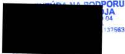
Lýdia Šuchová riaditeľka Agentúry na podporu výskumu a vývoja